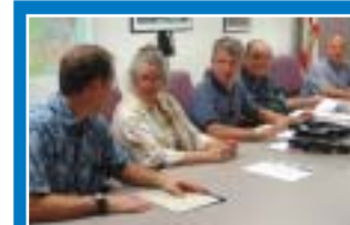
Miembros de la CIR en una reunión mensual.

La CIR reexamina y asiste a la MPO del Condado de Broward en la formulación de los planes y programas de transporte que dan forma al ambiente urbano del Condado. El grupo también considera el impacto