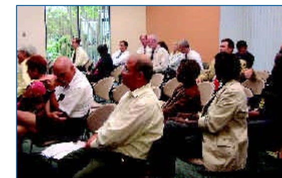
Moun nan piblik la ap swiv prezantasyon enfòmasyon ki nan ajanda a, pandan reyinyon rejyonal Komite Rezidan Konseye ki te fèt nan 14 jen an.

Reyinyon rejyonal sa yo enpòtan, paske yo pèmèt moun gade objektif pou lontan nan touletwa konte yo, epi komite konseye kominote yo ap patisipe aktivman nan pwosesis planifikasyon pou transpò a. Pou plis enfòmasyon sou reyinyon rejyonal ki fèt 2 fwa chak ane yo, oubyen pou enskri kòm manm nan Tab Wonn pou Patisipasyon nan Kominote a (CIR), gade nan adrès entènèt www.broward.org/mpo oswa rele nan nimewo 954-357-6608.