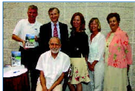
Tout oratè nan Fèt pou Granwout Touristik la te bay enfòmasyon detaye sou jan yo dwe kontinye seleksyon granwout touristik yo.

Nan dat 24 avril 2006 la, pèsennèl MPO Broward County a te òganize yon resepsyon espesyal nan Sant Konvansyon Broward County a pou fete reyalizasyon ak apwobasyon kondisyon pou pase Etap Elijibilite a, pou seleksyon Wout Eta Florid A1A a kòm wout touristik. Koridò 32 mil wout A1A ye a derape depi liy separasyon ant Broward County ak Palm Beach County a, pou rive nan liy separasyon ant Broward County ak Miami-Dade County a; li sèvi kòm yon koridò fonksyonèl milti-modal pou Konte a.