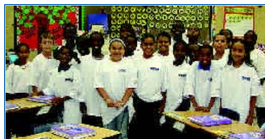
Elèv nan Morrow Elementary yo te bay pèsennèl MPO a yon sipriz, lè yo te mete mayo MPO a sou yo pou vizitè pèsennèl la te retounen fè nan lekòl la.

An 2004, Broward County MPO te òganize yon pwogram pilòt ki te mache byen, pou tabli kontak avèk elèv nan klas elemantè yo, ansanm ak paran oswa moun ki responsab elèv yo; pwogram la te esplikè tout bagay sou planifikasyon transpò ak sou enpòtans patipasyon kominote a nan pwosesis la. Depi premye prezantasyon ki te fèt nan Lekòl Elemantè Dillard la, pèsennèl la prezante pwogram la nan 12 lekòl elemantè ki plizyè kote nan Broward County.