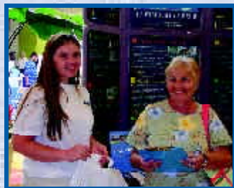
Anplwaye nan pèsennèl MPO a te bay moun nan piblik la esplikasyon detaye sou pwosesis planifikasyon transpò a.