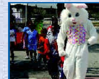
Timoun yo te pran anpil plèzi nan aktivite pou amizman yo, nan Lauderdale Spring Fling.