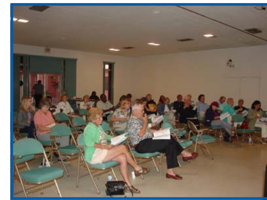
La asistencia al Taller sobre la Carretera Panorámica A1A incluyó a miembros del público de más de 15 municipalidades del Condado de Broward.