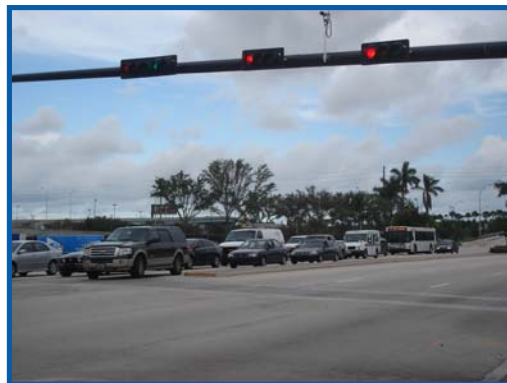
Los corredores de tránsito muy denso, como la parte del Broward Blvd que se muestra aquí, están ofreciendo grandes oportunidades para el Redesarrollo Orientado al Transporte Público/Vivienda en el Condado de Broward.

En septiembre de 2006, la División de Servicios de Planificación del Condado de Broward solicitó y recibió $75,000 para un Estudio Piloto Comunitario para crear planes para un desarrollo de uso mixto orientado al transporte público a lo largo de la Carretera Estatal 7 (I-595 a Peters Road/Davie Boulevard) y Broward Boulevard (I-95 a la Carretera Estatal 7).