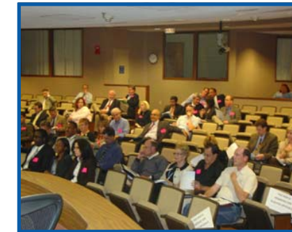
Varias agencias de transporte, así como miembros del público, asistieron a la Cumbre para el Financiamiento del Transporte Regional 2008 de la SEFTC.

El Consejo de Transporte del Sudeste de la Florida (SEFTC) fue creado para prestar servicio como un foro formal para la comunicación y coordinación de políticas para llevar a cabo iniciativas regionales acordadas por las MPO de los condados de Broward, Miami-Dade y Palm Beach. Para obtener más información sobre el SEFTC, visite http://www.miamidade.gov/mpo/seftc/home.htm .