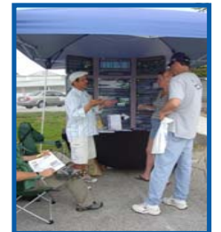
Los integrantes del público dedicaron parte de su tiempo en el Gardenfest 2008 para hablar con el personal de la MPO de Broward acerca de problemas de transporte que consideraban de importancia.